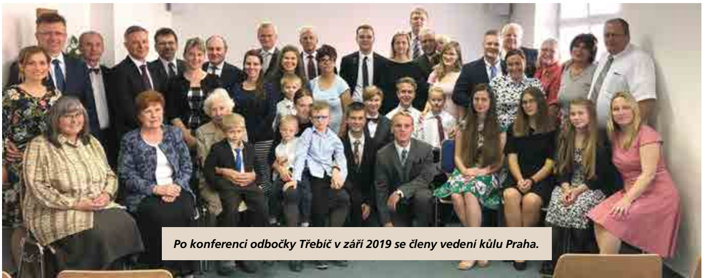
Po konferenci odbočky Třebíč v září 2019 se členy vedení kůlu Praha.