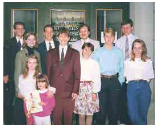
Členové po nedělním shromáždění odbočky Třebíč v září 1995 před budovou na Karlově náměstí.

tábory jógy, ačkoli podstatnou součástí přednesů byly zásady evangelia Církve. Z tohoto vlivu vzešlo mnoho prvních členů, kteří se stali vedoucími v rané Církvi v Československu. Pán dal, aby ani Třebíč nezůstala opodál, a můj otec se tím připravoval na budoucí roli v Pánově díle. I když jsem to tenkrát takto nevnímal, tato a další setkání měla v příštích několika letech udávat kurz i mému životu. Mezitím táta doma studoval zvláštní červené knižičky (tehdejší vydání překladu Knihy Mormonovy a dalších písem), později byl, do tehdy ještě ilegální Církve, pokřtěn a v srpnu 1989 navštívil chrám ve Freibergu.